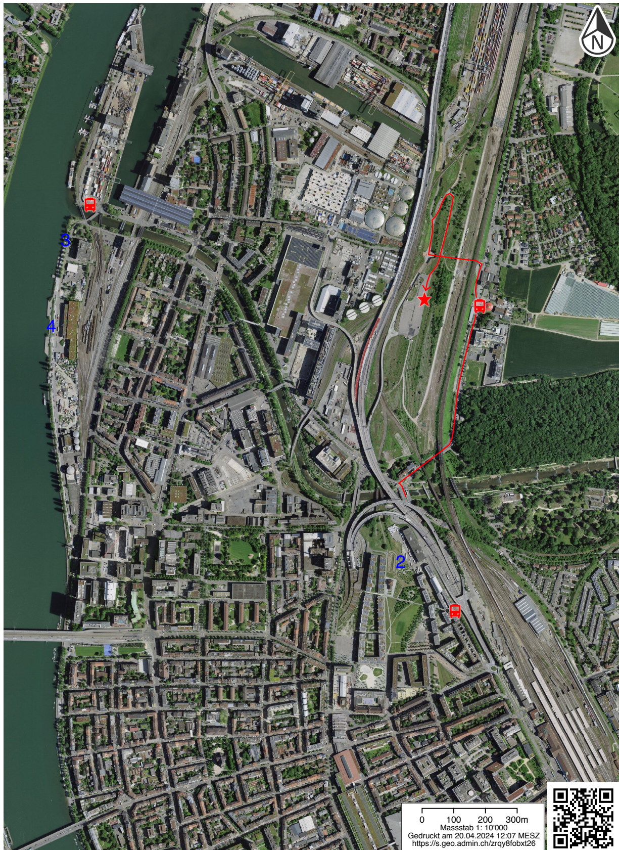
Abb. 2: Luftbild mit Position des Treffpunktes (★: 612260/269960) auf dem Industrieparkplatz im DB-Areal. Markiert sind auch die weiteren Exkursionsziele «Erlenmattsiedlung» (2) und «Rheinhafen» (3 und 4). Ferner sind nebst der Zufahrtsstrecke (→) zum Treffpunkt auch die den jeweiligen Exkursionszielen (★, 2, 3, 4) nächstgelegenen Bushaltestellen («Otterbach Grenze», «Signalstrasse», «Rheinhafen») eingezeichnet.