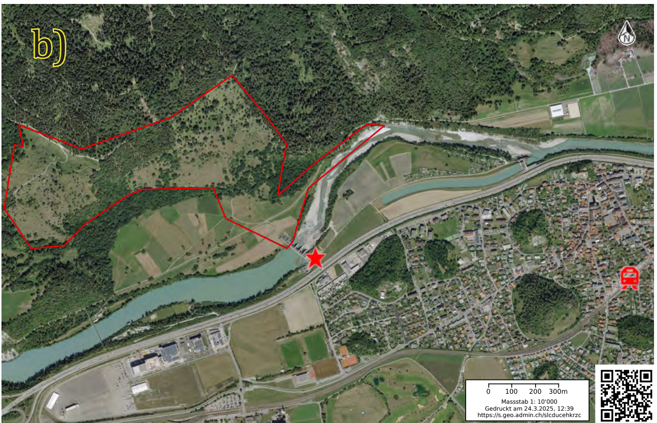
Abb. 1. Karte (a) und Luftbild (b) mit Position des Treffpunktes (★ : 752326/188969) in Domat/Ems und Lage des rot umrandeten Exkursionsgebietes (–) in der Gemeinde Tamins. Eingezeichnet ist auch der Bahnhof Domat/Ems (Zugsymbol).