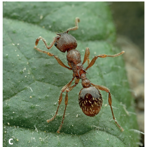
Abb. 4. Frontalansicht a ), Seitenansicht b ) und Aufsicht c ) einer lebenden Arbeiterin von Myrmica curvithorax .