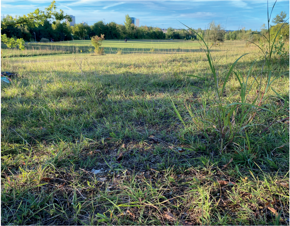
Abb. 2. Habitat von Myrmica curvithorax im Untersuchungsgebiet.

Allmend vollständig einschliesst (Abb. 1). Dieses Gebiet entstand durch Aufschüttung von Aushub vom Bau eines knapp 5 km langen Eisenbahntunnels (Zürichberg tunnel), welcher im Jahr 1990 eröffnet wurde. Der Untergrund besteht vor allem aus Mergel und ist nur spärlich von Pflanzen bewachsen (Abb. 1 und 2). Auf dem Areal befinden sich aber auch kleine Waldstücke sowie Tümpel und wechselfeuchte Wiesen. Die Umgebung besteht aus urbanen Siedlungsgebieten, Sportplätzen, Landwirtschaftszonen und Wäldern mit für das schweizerische Mittelland typischen Biotopen.